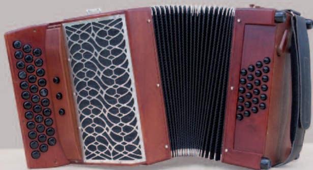
28 x 17 x 38 cm • 5,0 kg

sommiers spéciaux pour les cases aiguës • registres automatiques et accessibles • soupape d'air ergonomique, rapide et sensible • basse profonde sur sommier à prolongement • soufflet 21 plis.